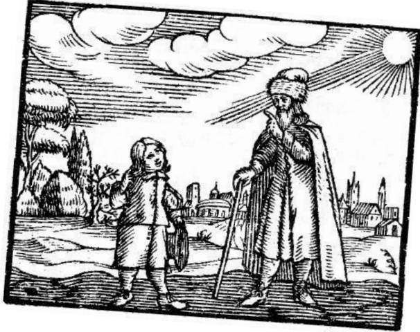
Orbis sensualium pictus