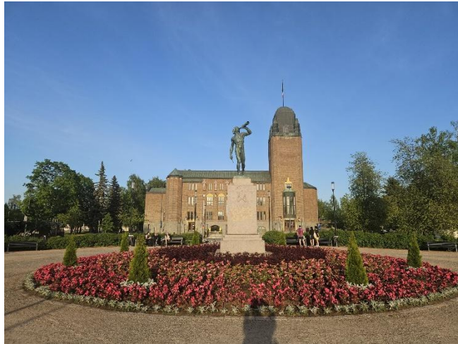
Joensuu im Sommer